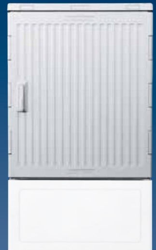
Gehäuse 82/400 mit Glasfasermanagement (Beispielausstattung)

Spindel FIST-GR2-DRM (54.6200.16.00) für Umlenkung Glasfaserkabel (Zubehör)